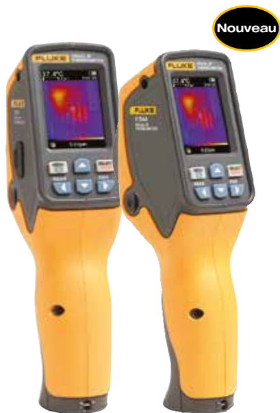
Fluke VT04 et VT04A