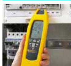
Localisation des fusibles et disjoncteurs et affectation aux circuits